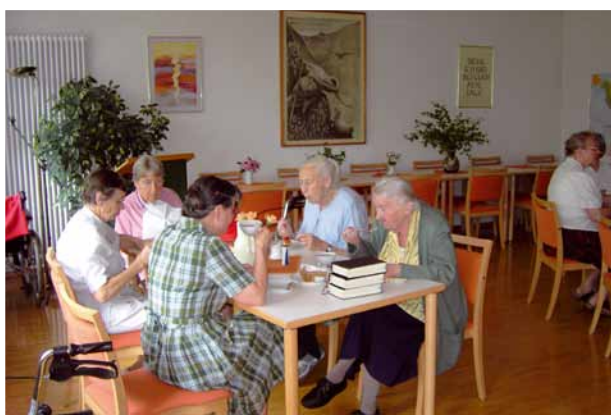
Im Erdgeschoss des Missionsheims ist der Speisesaal. Bewohnerinnen und Gäste erleben Gemeinschaft bei den Mahlzeiten, bei Geburtstagsfeiern und bei festlichen Anlässen.

Erfordernissen der Zeit angepasst. Die Bewohnerinnen leben im Älterwerden in christlicher Gemeinschaft. Heute sind es Frauen, die hauptamtlich, nebenberuflich oder ehrenamtlich in Mission, Kirche oder Diakonie tätig waren und im beruflichen Fei-