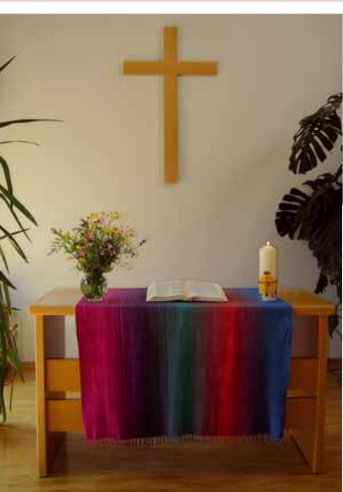
Geistliche Mitte der Hausgemeinschaft ist die Sammlung unter Gottes Wort. Im Obergeschoss des Missionsheims ist der Andachtsraum, der auch über einen Aufzug erreichbar ist.