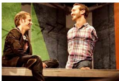
Interview mit Nick Vujicic.